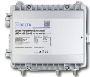
|| FOSTRA-F FSK-RX